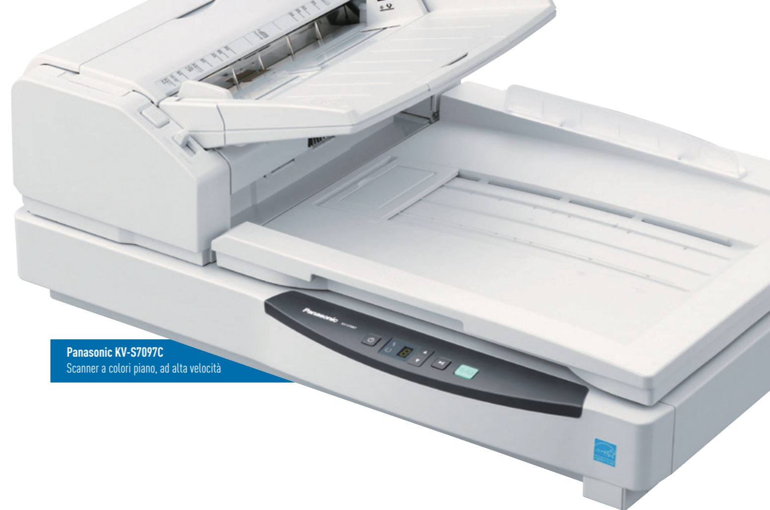
Panasonic KV-S7097C Scanner a colori piano, ad alta velocità

Anche il processo di verifica del veicolo all'ingresso presso la vostra sede è supportato efficacemente da uno scanner per documenti. La moderna tecnologia di riconoscimento ottico dei caratteri (OCR) consente di registrare le verifiche dei veicoli manualmente e poi di elaborarle tramite scanner, in modo da consentire al software OCR di rilevare e quindi registrare le caselle contrassegnate.