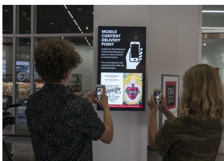
Le contenu est transmis à l'application du smartphone via l'écran d'affichage