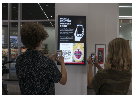
Inhalte werden durch die Displays an die Handy-App übertragen