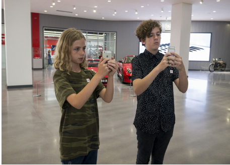
LinkRay teknolojisiyle tümleşik mobil uygulamanın nasıl kullanıldığını gösteren iki çocuk