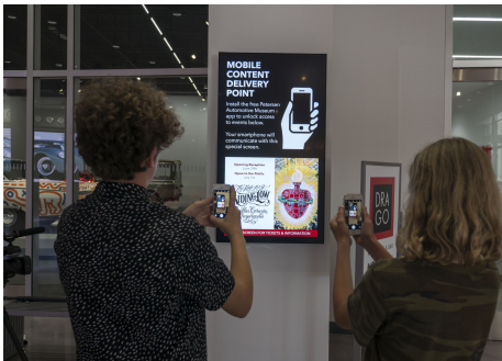
Sergi ekranı aracılığıyla cep telefonu uygulamasına gönderilen içerik