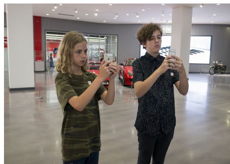
Twee kinderen laten zien hoe de mobiele app met LinkRay moet worden gebruikt

Het Automotive Museum heeft onlangs een uitgebreide, 125 miljoen dollar kostende renovatie ondergaan en is in december 2015 heropend. Met bijna 28.000 extra vierkante meters werden samenwerkingen aangegaan met een aantal grote merken, zoals Maserati, Ford en Lucas Oil, zodat het museum kon worden gevuld met meer opvallende stukken en tentoonstellingen.