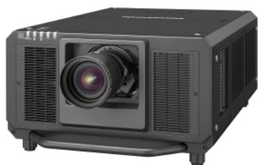
PT-RZ31K - un proiettore a laser da 30.000 lumen di Panasonic

Per la prima volta in assoluto, Panasonic Visual Systems e NovaLine hanno impiegato una tecnologia avveniristica in grado di creare ologrammi di forte impatto realistico durante i quattro concerti "Holland zingt Hazes", eseguiti in onore di André Hazes presso lo Ziggo Dome.