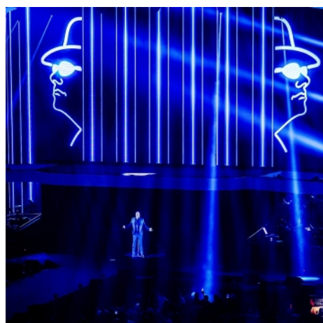
L'ologramma di André Hazes proiettato nel corso di "Holland zingt Hazes"