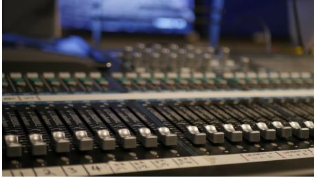
La table de mixage de 32 canaux permet de contrôler l'ensemble de l'auditorium, y compris le projecteur Panasonic.

Avec une épaisseur de moins de 62 mm, ce design fin permet une installation discrète en montage mural avec son cadre fin et aide le public à se concentrer sur l'image affichée.