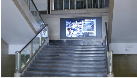
L'écran 4K dans le hall d'accueil du RIBA.