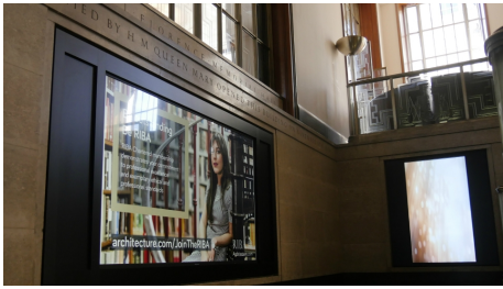
Le nouvel écran 4K 98 pouces à côté d'un des deux écrans Full HD 65 pouces (TH-65LFE8).