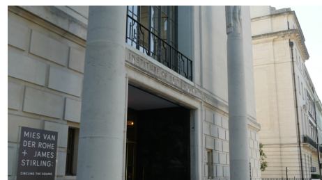
Siège historique du RIBA à Portland Place, Marylebone.