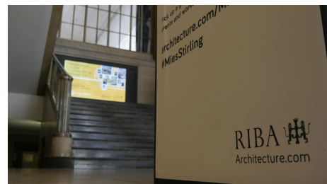
Le hall d'accueil du RIBA arbore le nouvel écran 4K 98 pouces de Panasonic.

La série LFE8 peut être montée en orientation paysage, portrait ou en configuration multi-écrans, et est souvent utilisée pour l'affichage des menus et l'affichage urbain.