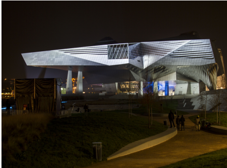
Vista que muestra la singular forma del Museo de las Confluencias