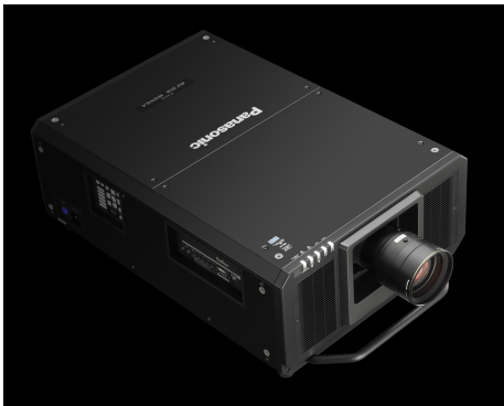
Se utilizaron siete proyectores láser de alto rendimiento PT-RZ31K, cada uno con 30 000 lm

El festival se celebra alrededor del 8 de diciembre y en él los habitantes de Lyon rinden homenaje a la Virgen María, cuya estatua puede verse en la Basílica de Fourvière que domina la ciudad. Los habitantes colocan velas y luces en los alféizares y balcones, y organizan desfiles callejeros.