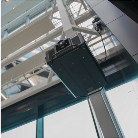
Girişteki Panasonic PT-RZ31K lazer projektör

Media City Bergen, Bergen şehir merkezinde tek bir çatı altında iki medya evinin yanı sıra bir dizi medya teknoloji şirketlerini, eğitim ve araştırma topluluklarını barındıran bir bilgi ve iş merkezidir.