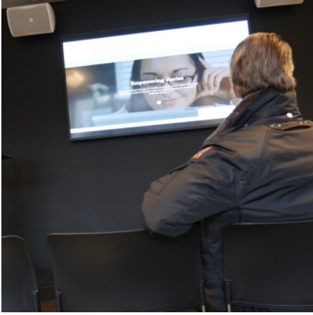
Media City Bergen'deki basın toplantısı alanı