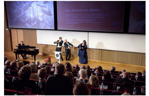
"Den Kongelige Opera" bij de universiteit van Kopenhagen