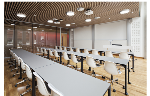
In totaal zijn meer dan 20 km kabel en 4500 eenheden geïnstalleerd in de verschillende vergaderruimtes, college- en conferentiezalen, hoorzalen en openbare ruimtes.

Panasonic Marketing Europe GmbH Hagenauer Str. 43 65203 Wiesbaden Duitsland