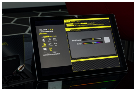
Controllo intuitivo dei contenuti