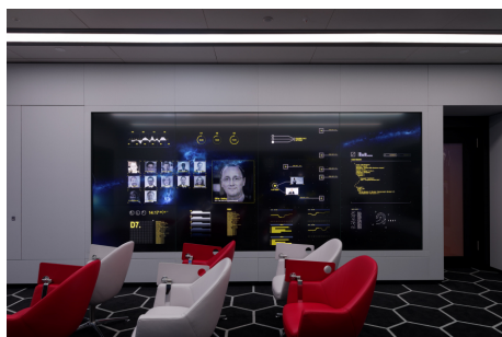
48 display TH-55VF1HW creano lo spazio collaborativo del futuro