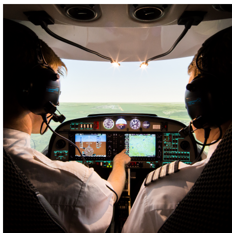
Illustrazione di una simulazione di volo in corso

Panasonic France 1 à 7 rue du 19 Mars 1962 92238 Gennevilliers Cedex France ☎ +33(0)1 47 91 64 00