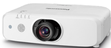
Proiettore PT-EZ590 Panasonic