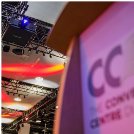
Aan het plafond hangende projectie bij het CCD

Gasten worden bij aankomst bij het Convention Centre Dublin verwelkomd door een bord met de zin 'Céad Míle Fáilte' of 'Honderdduizendmaal welkom'. Het CCD is opgericht als conferentielocatie van wereldklasse, middenin de hoofdstad van Ierland.