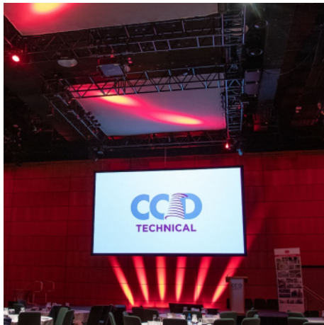
Kenmerkende installatie voor een evenement bij het CCD