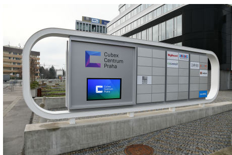
Écran pour l'extérieur