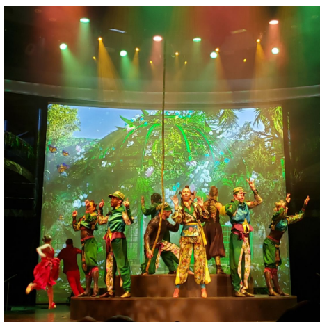
Teatro Oculus