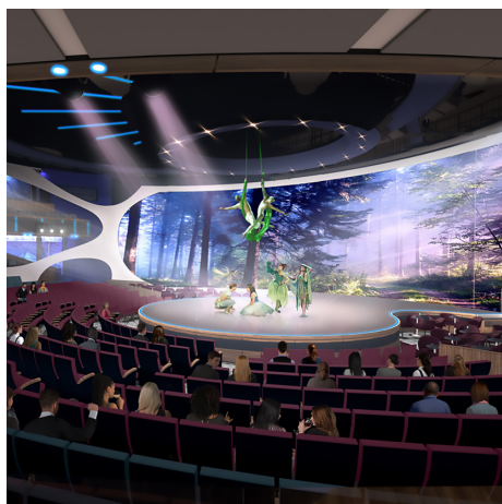
Teatro Oculus