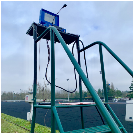
Pupitre de contrôle des faux départs