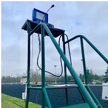
Steuerpult für die Ermittlung von Fehlstarts