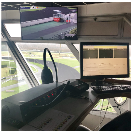
Software zur Kontrolle und Aufzeichnung der Kameras