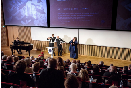
Den Kongelige Opera à l'Université de Copenhague

Le Panum Institute entend abriter quelques-unes des installations les plus avancées au monde pour la recherche et l'enseignement dans le domaine de la santé et des maladies.