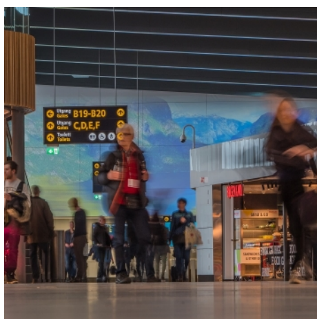
La proyección en la zona de operaciones cuenta con tres proyectores láser RZ31K