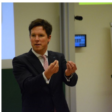
Sala conferenze IPC-001 a WHU