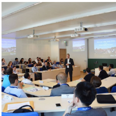
IPC-001 - la sala conferenze principale di WHU