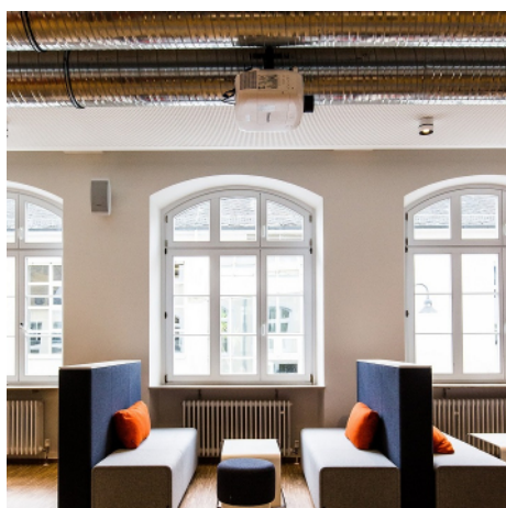
Proiezione all'In Praxi Learning Center