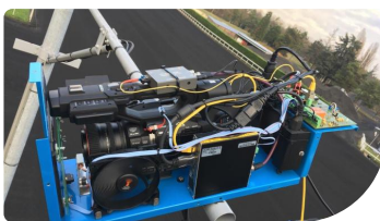
Una cámara AG-UX180 en el Hipódromo de Vincennes