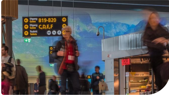
Die Projektion zur Flugfeldseite mit drei RZ31K-Laserprojektoren