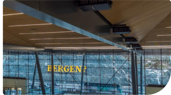
Alle Projektoren sind unauffällig an der Decke angebracht