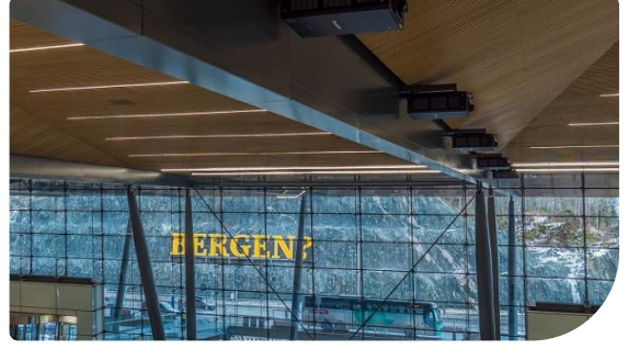
Tüm projektörler tavana gizlice monte edildi