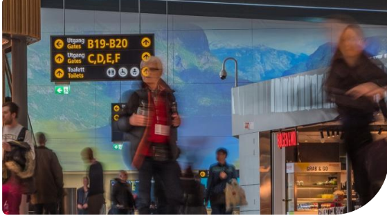
Apron tarafındaki projeksiyonda üç adet RZ31K lazer projektör bulunuyor