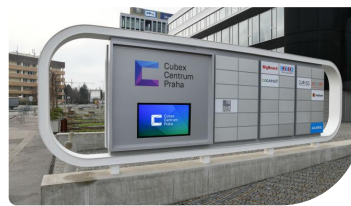
Display per esterni