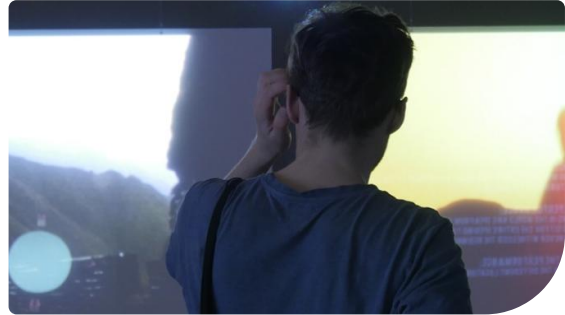
Marina Abramović utiliza los sistemas de proyección láser de Panasonic en el Moderna Museet