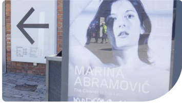
Marina Abramović en el Moderna Museet de Estocolmo