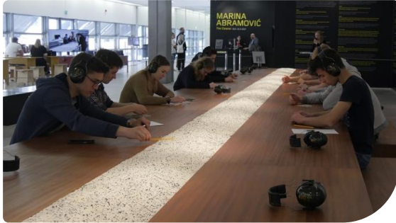
Marina Abramović invita a los visitantes del Moderna Museet a realizar algo mundano, como contar granos de arroz y lentejas en silencio