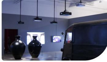
Marina Abramović utiliza los sistemas de proyección láser de Panasonic para mostrar su trabajo con el artista Ulay, su pareja