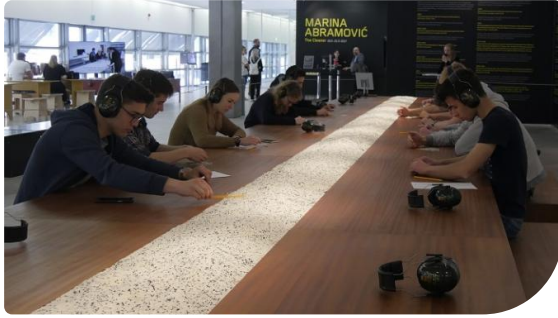
Marina Abramović invita a los visitantes del Moderna Museet a realizar algo mundano, como contar granos de arroz y lentejas en silencio