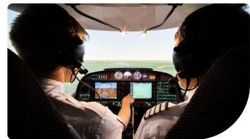
Darstellung der laufenden Flugsimulation