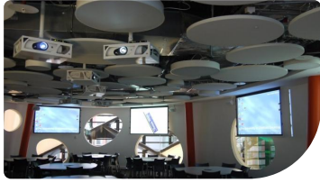
Der Empfangsbereich des RIBA mit dem neuen 98-Zoll-4K-Display von Panasonic