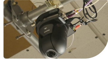
Der historische Sitz des RIBA am Portland Place im Londoner Viertel Marylebone